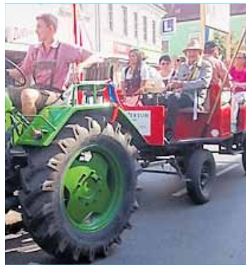
Bunt geschmückte Wägen verzückten die Gäste.