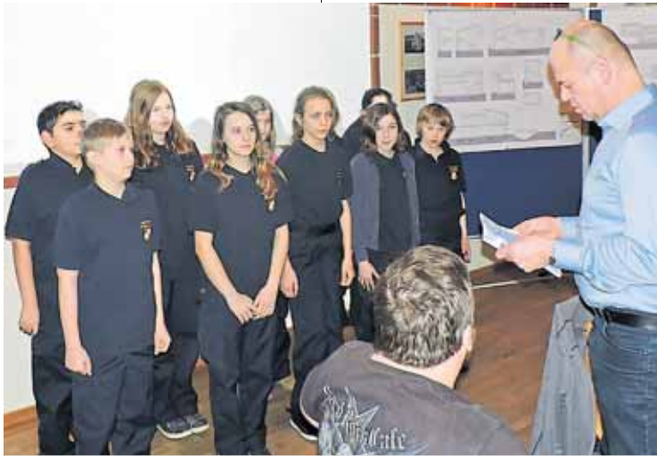
Die Mitglieder der Feuerwehrjugend Riedenthal wurden bei der Hauptversammlung angelobt.