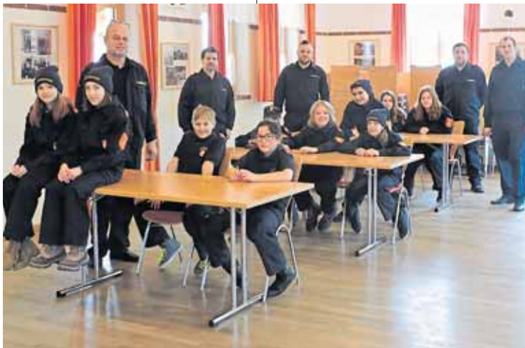
Die erste Erprobung in Form eines Erprobungsspiels fand im Dorfgasthaus Riedenthal statt.