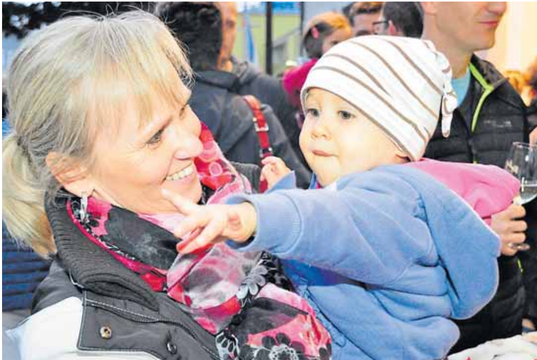
Groß und klein fiebern in Gänserndorf dem kommenden Freitag (4. Mai) entgegen. Da lädt das werbe-team (mit Unterstützung der Stadtgemeinde) wieder zur traditionellen Einkaufsnacht im Frühling ein. Über 30 Firmen beteiligen sich mit tollen Aktionen in (und bei Schönwetter vor) den Geschäften. Klar, dass auch ein Top-Rahmenprogramm auf der Agenda steht.